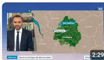
8 mai 2025 JT 673 vues • il y a 7 mois