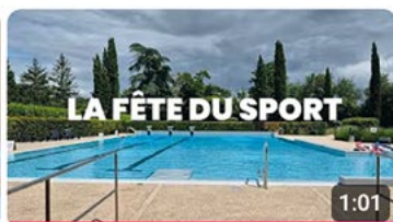
Fête du sport 122 vues • il y a 6 mois