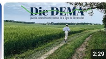
Die dema 2025 1 k vues • il y a 7 mois