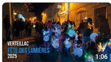
Fête des lumières 2025 à Verteillac