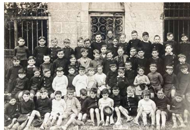
Photo de classe 1937