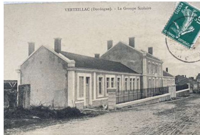
Carte postale du groupe scolaire vers 1920

Question : À vos souvenirs, à vos archives, Verteillacoises et Verteillacois : qui reconnaissez-vous sur ces photos de classe ?