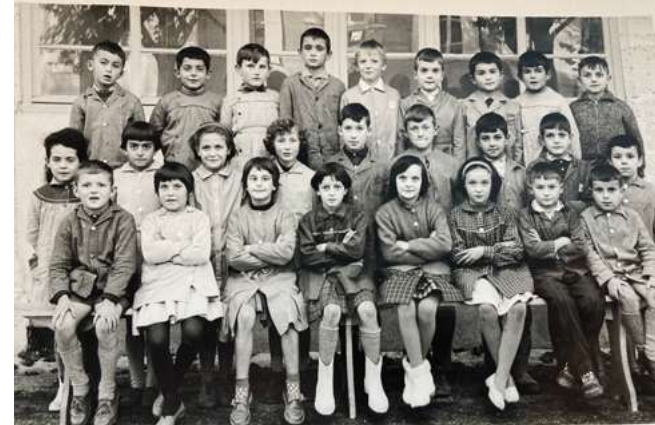
Photo de classe 1965